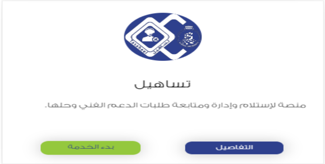
Figure 3: الدخول على الخدمة.

ويمكن الوصول لطلب الدعم الفني للخدمة عبر خدمة تساهيل وذلك من خلال الاختيار من كتالوج الطلبات – ثم اختيار التطبيقات والأنظمة Application and systems – واختيار جامعتي My BU