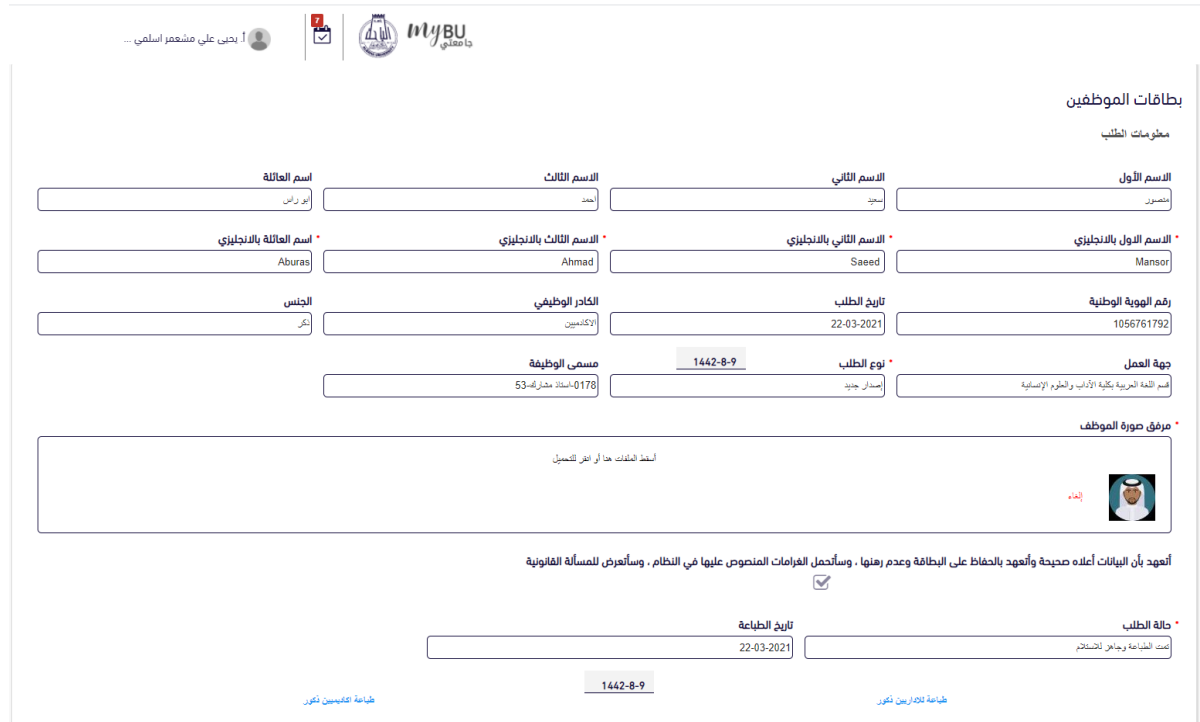
Figure 3: شاشة منفذ الخدمة