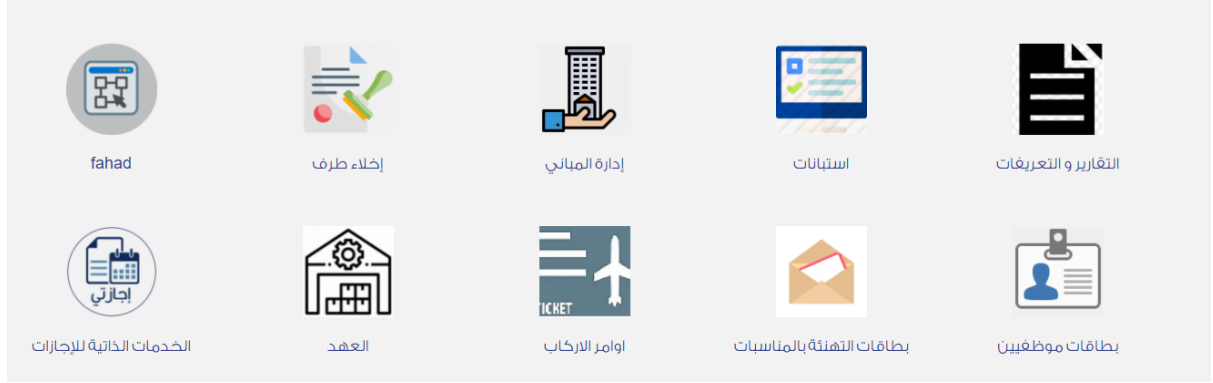
Figure 1: الدخول على الخدمة.

توضيح آلية الدخول وإستخدام الخدمه كما في الصورة التالية: